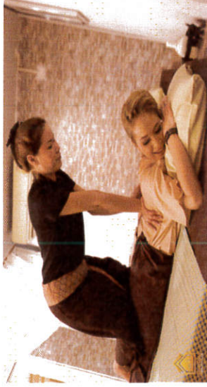
การนวดแผนไทย